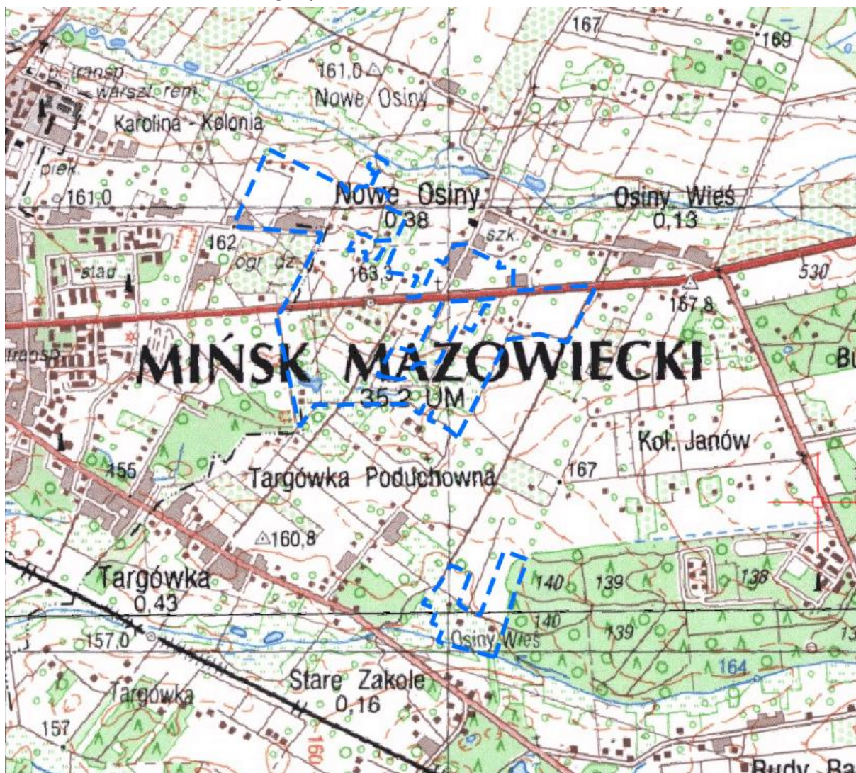
Rysunek 1 Położenie obszaru opracowania na mapie topograficznej przedstawiającej fragment gminy Mińsk Mazowiecki

Gmina wiejska Mińsk Mazowiecki znajduje się w centralnej części województwa mazowieckiego, w powiecie mińskim i otacza miasto Mińsk Mazowiecki. Zajmuje powierzchnię ok. 112,31 km 2 i jest zamieszkiwana przez 16 996 osób (dane za 2023 rok).