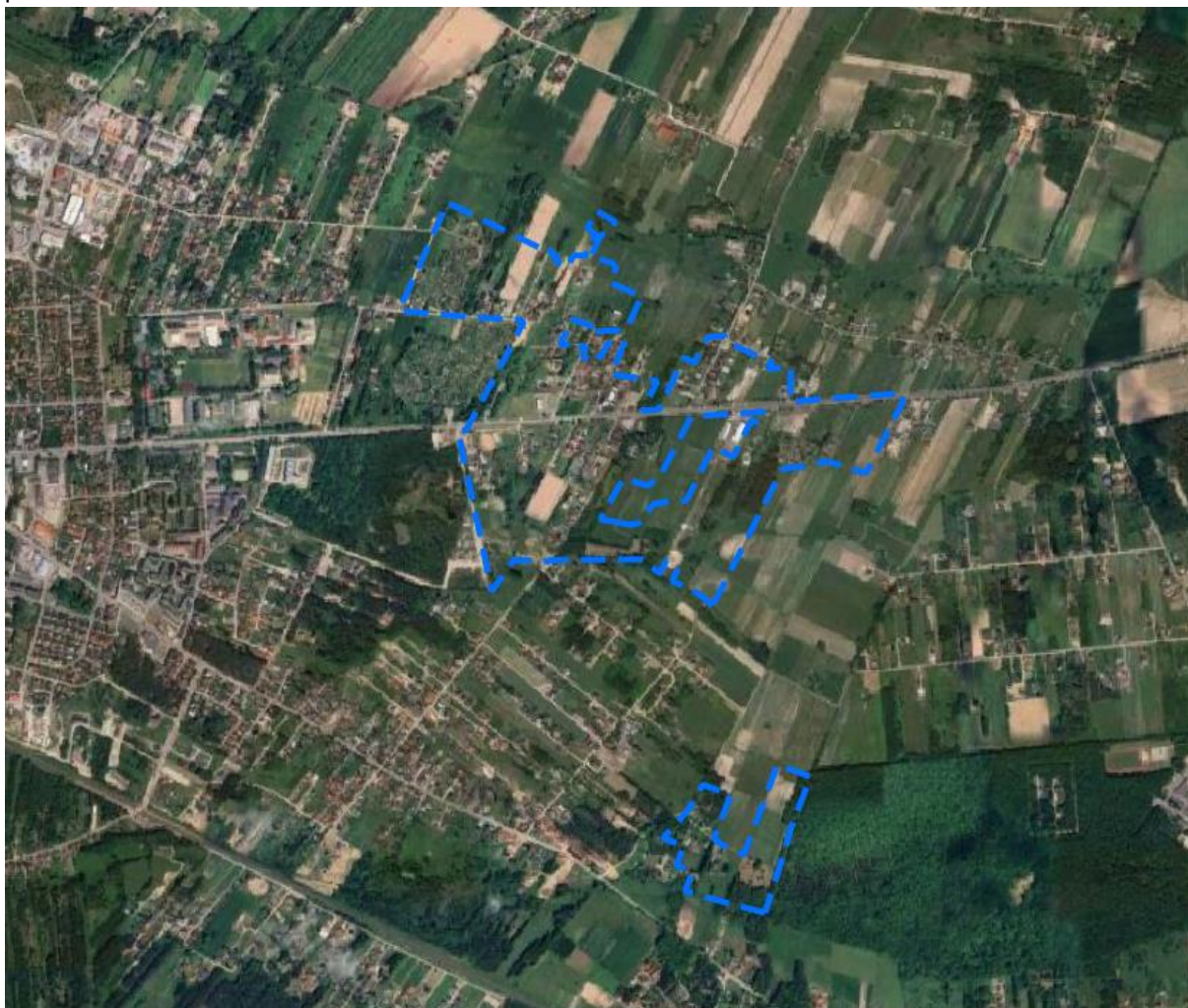
Rysunek 2 Obszar objęty ustaleniami planu miejscowego zaznaczony na ortofotomapie

W krajobrazie obszarów opracowania, dominują tereny otwarte w formie pól uprawnych, łąk i pastwisk.