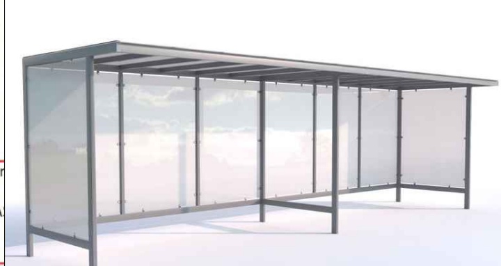
PROJEKTOWANA WIATA NA 15 ROWERÓW